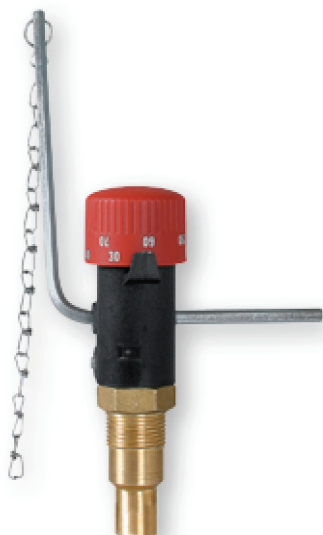
REGULATOR PENTRU CONTROLUL ARDERII FR1

Regulatorul de tiraj FR1 reglează cantitatea de aer de combustie în cazanele pe combustibil solid.