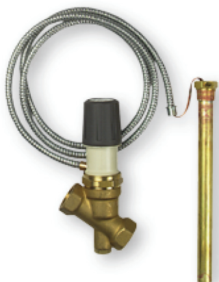
VENTIL TERMIC DE SIGURANȚĂ TSK

Ventilul termic de siguranță TSK pentru cazane pe combustibil solid conform EN 12828 cu capacitate maximă de încălzire de 80.000 kcal.