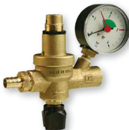
ALIMENTATOARE AUTO. FA, FAM

Alimentatoarele automate pentru sisteme de încălzire închise, conform DIN 4751. Carcasa și capacul sunt fabricate din alamă.