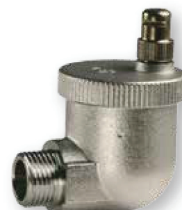
AERISITOR AUTOMAT COLȚAR