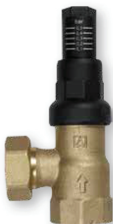
VENTIL DE BY-PASS

Ventil diferențial cu scală de reglare pentru menținerea constantă a presiunii pompei în circuite închise și pentru diminuarea zgomotelor.