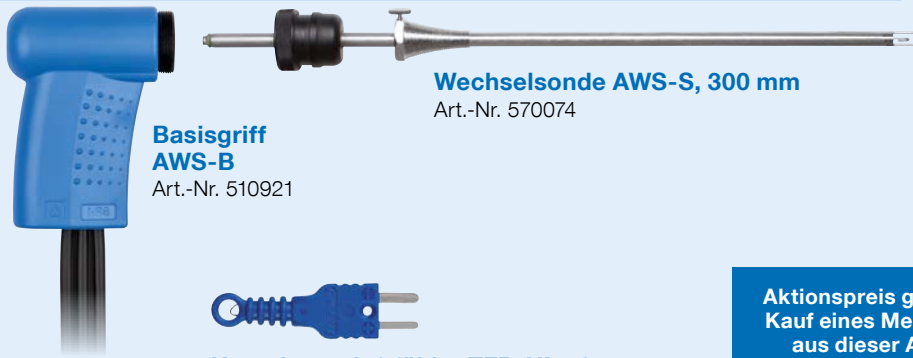
Basisgriff AWS-B Art.-Nr. 510921