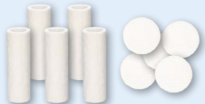
Ersatzteilpaket Gasaufbereitung KFP Art.-Nr. 500208

Aktionspreis gültig beim Kauf eines Messgerätes aus dieser AKTION