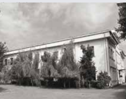
Sediu AFRISO Bucuresti

AFRISO prezintă o nouă premieră, o inovație absolută în domeniul încălzirii și alimentării cu apă: primul termodebitmetru electronic portabil, pentru apă, FlowTemp ST®.